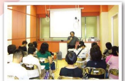
深水埗區服務簡介會