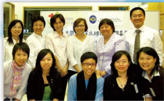
深水埗區地區支援協調委員會