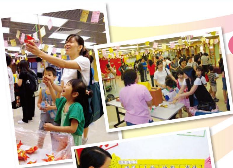
小蜜蜂獎勵計劃遊戲日：節目豐富，學生與家長投入參與，樂也融融。